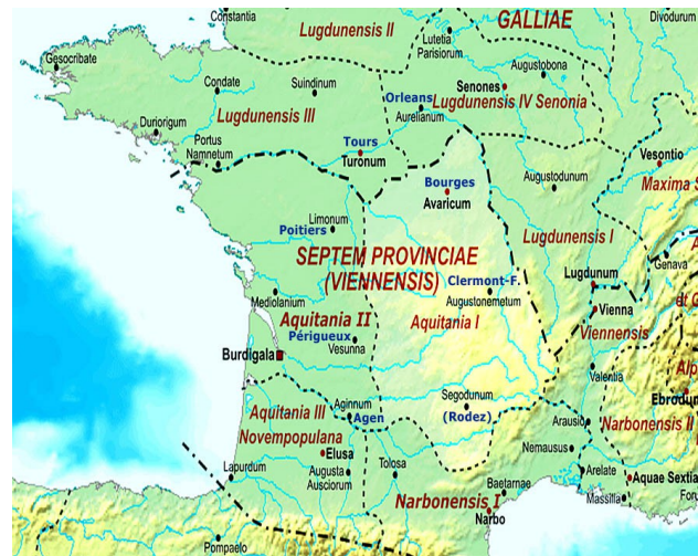
Die Aquitania prima um 400 n. Chr.

Weite Teile der secunda zählten längst zum westgotischen Kerngebiet. Karte (Ausschnitt): Constantine Plakidas