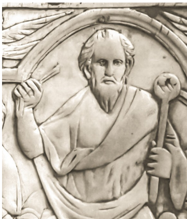
Aëtius auf einem Elfenbein-Diptychon Teilausschnitt Archivbild Berry Museum, Bourges

Jedoch hatte Childerich wegen seiner vielmehr machtpolitisch als sexistisch zu sehenden Flucht aus seinem Herrschaftsbereich noch eine Rechnung mit Aegidius zu begleichen, deren Höhe die Fredegar -Chronik mit nicht weniger als Childerichs persönlichem Hilfeappell an den oströmischen Kaiser gleichgesetzt haben will. Childerich mag durchaus konform mit Ricimers Strategie gegangen sein, vor allem mit der Perspektive, durch Aegidius' Unterwerfung dessen auch wirtschaftlich lukratives Territorium übernehmen zu können!