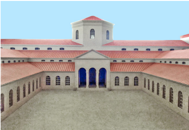
Das Praetorium der CCAA (Hofansicht)