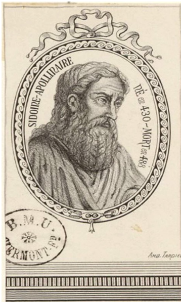
Sidonius Apollinaris, Arcadius' Großvater. Lithografie 19. Jhdt.

Diese Annahme käme Gregors Erzählstil noch insofern entgegen als er in seinem Bericht ( hist. III,9 ) Theuderichs Ankunft aus Thüringen in keiner Weise militärisch apostrophiert – zumal er sich noch im vorausgegangenen Kap. III,7 auf unübersehbare kriegerische Schilderungen von dessen Thüringerzug verlegt hat. Zur Datierung dieses von Arcadius geschürten Umsturzversuchs „um 531“, also zu Beginn oder während des Thüringerkriegs, könnte aber auch Gregors unmittelbare Bezugnahme auf Childeberts gleichzeitig oder allenfalls nur wenig danach gestartete „Strafexpedition“ gegen den Westgotenkönig Amalariich gelten gemacht werden, der ihm bei Narbonne unterlag und schließlich auf der Flucht vor dem Frankenkönig in Barcelona im Jahr 531 getötet wurde. Nachdem Gregor über diesen Westgotenkrieg flugs in Kap. III,10 weiter berichtet und sich gleich im Anschluss auf Childeberts Kriegszug mit seinem Bruder Chlothar gegen den Burgunder Godomar II. als die im Jahr 532 ausgetragene Schlacht bei Autun bezieht ( hist. III,11 ), liefert er erst in Kap. III,12–13 den von Theuderich ausgetragenen Krieg in der Auvergne. 11