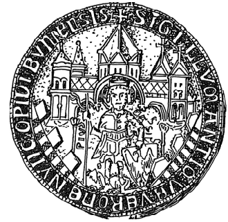
Siegel der Stadt Bonn, 13. Jhd. („früher Verona, jetzt Stadt Bonn“)