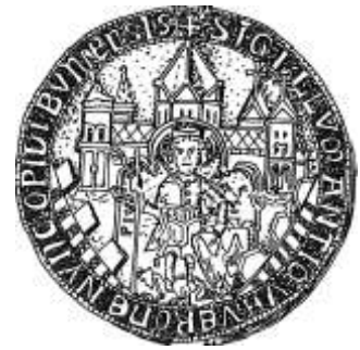
Siegel der Stadt Bonn, 13. Jhd. („früher Verona, jetzt Stadt Bonn“)