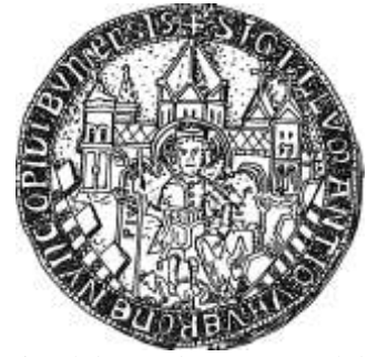
Siegel der Stadt Bonn, 13. Jhd. („früher Verona, jetzt Stadt Bonn“)