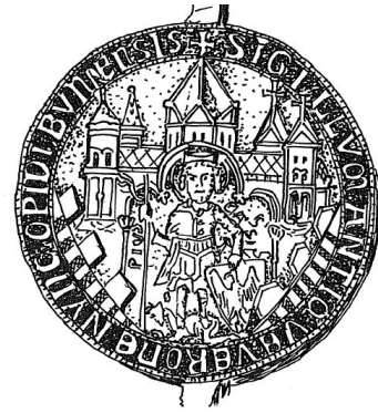
Siegel der Stadt Bonn, 13. Jh. („früher Verona, jetzt Stadt Bonn“)

Dietrich von Bern-Forum. Verein für Heldensage und Geschichte e. V. www.dietrich-von-bern-forum.de