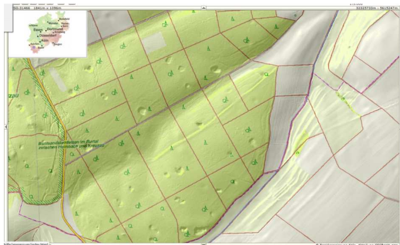
Geländemodell mit erkennbaren Pingen aus Messungen eines Radarsatelliten.

Um jedoch einen überzeugenden Nachweis für den bergbaulichen Ursprung dieser im Badewald zahlreich vorhandenen Restlöcher (Pingen) zu finden (siehe nachfolgende Abbildung), wird es notwendig sein, die Technologie „ Geographische Informations-Systeme “ (GIS) zu verwenden. Die rechnerbasierten GIS gestatten es, jegliche Information, die mit einer Koordinate verknüpft werden kann, mit einer topographischen Karte zu verbinden und somit nach komplexen Zusammenhängen unterschiedlicher Attribute zu suchen.