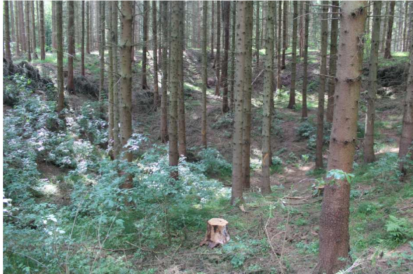
Abbaubedingte Pinge mit erkennbarem Erdsattel in der Mitte (Zufahrt zur Gube)

Traten die Erzvorkommen an die Erdoberfläche, brachen häufig durch Erosionsprozesse o.ä. verursachte größeren Gesteinsbrocken aus dem Erzverband heraus. Diese Brocken, die sogenannten Molterstücke, wurden von den Kelten und Römern ebenfalls abgebaut, ohne Restlöcher mit größeren Erdwällen zu hinterlassen.